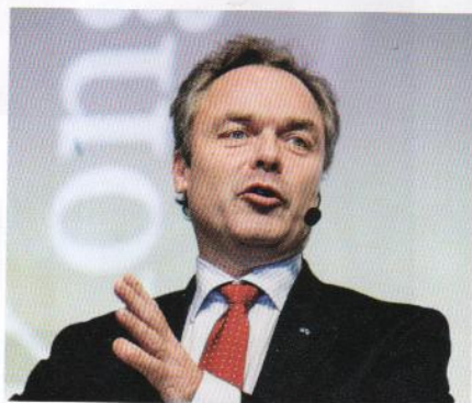
Utbildningsminister Jan Björklund.

Han beskrev bristen på civilingenjörer som ett resultat av 1990-talets utbildningspolitik, som förenade "det sämsta